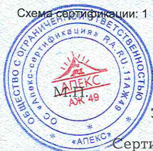
Схема сертификации: 1